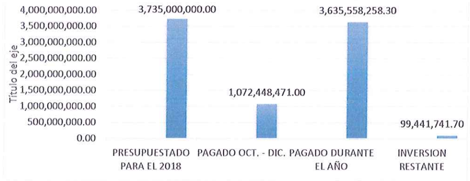
Ilustración 1: Resumen de la Inversión en 2018