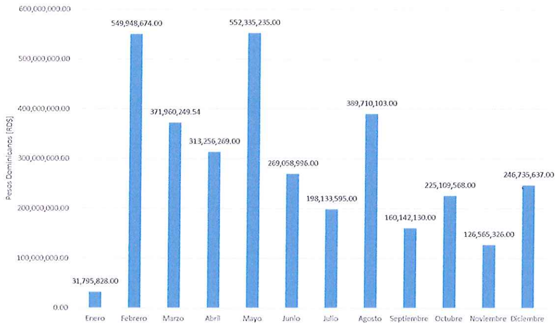
Ilustración 2: Evolución de la Inversión Durante 2019