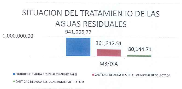
Gráfico extraído del informe mensual.