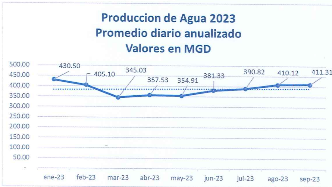
Gráfico no. 1