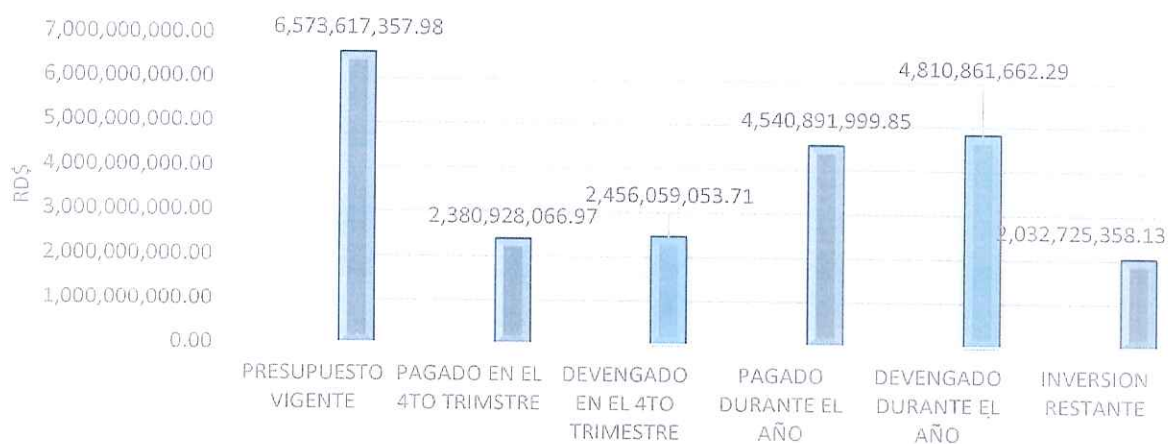
Ilustración 1: Resumen de la Inversión en 2025